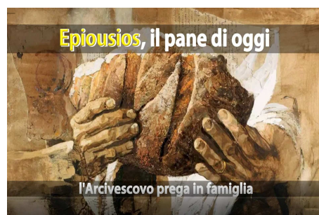
l'Arcivescovo prega in famiglia